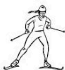
Ski de Fond